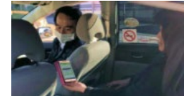
MaaSアプリを利用したタクシー配車（群馬県前橋市）