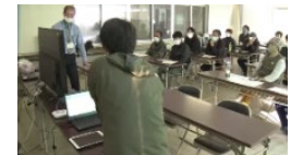
データを活用したスマート農業の取組（高知大学）