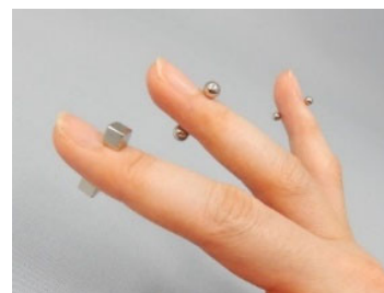
指を挟んでも付く程の強い磁力を持つマグネットボール

マグネットボール、キューブを誤飲すると生死に関わることがあります。少しでも誤飲が疑われる場合には、すぐに医療機関を受診してください。