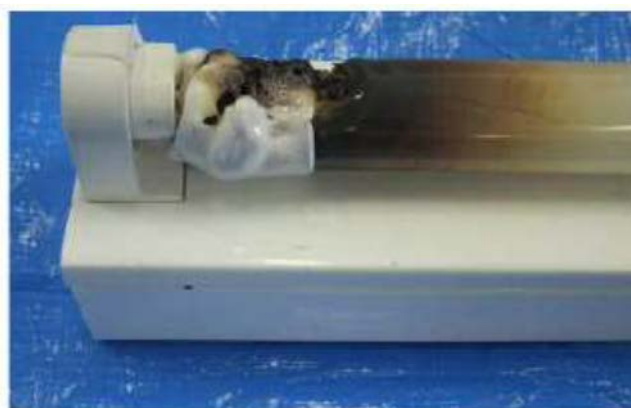
図 9. 直管 LED ランプの損傷例

このため、直管 LED ランプや環形 LED ランプ等を蛍光灯照明器具に取り付ける場合、LED ランプの給電方式と蛍光灯照明器具の点灯方式の組合せによっては、内部の電子部品が異常加熱する等の現象が発生し、発煙・発火の原因となるおそれがあります（図 9）。