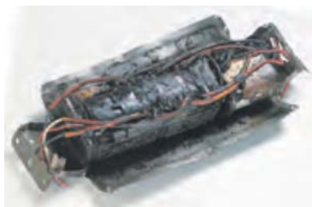
図10. 蛍光灯器具の内部にある安定器が劣化した例

また、事故を防止するためにも、年に一回は安全チェックシート(図11参照)で照明器具の点検を行いましょう。