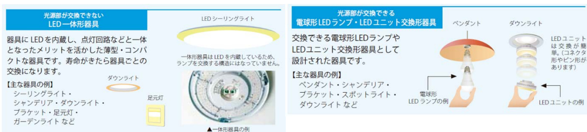
図2. 一般家庭用のLED照明のタイプ 4

一般家庭用のLED照明は大きく分けると、光源（ランプ）部と器具（照明器具）部に分かれているものと、器具にLEDランプを内蔵し光源部が交換できない一体形になっているものがあります（図2）。また、LEDランプは、電球や蛍光灯などの従来のランプと同様のサイズや形状で、同じ口金を持ち、従来の照明器具に同じように取り付けることができるようになっているものも多く販売されています（図3）。