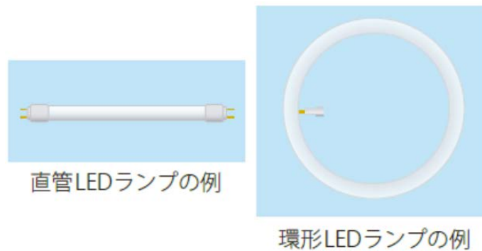
図 8. 直管/環形 LED ランプの例

直管 LED ランプ、環形 LED ランプは、それぞれ従来の直管蛍光灯、環形蛍光灯と同様の形状をしており（図 8）、中には、従来の蛍光灯と同じ端子・口金を持ち、従来の照明器具に同じように取り付けられるものがあります。