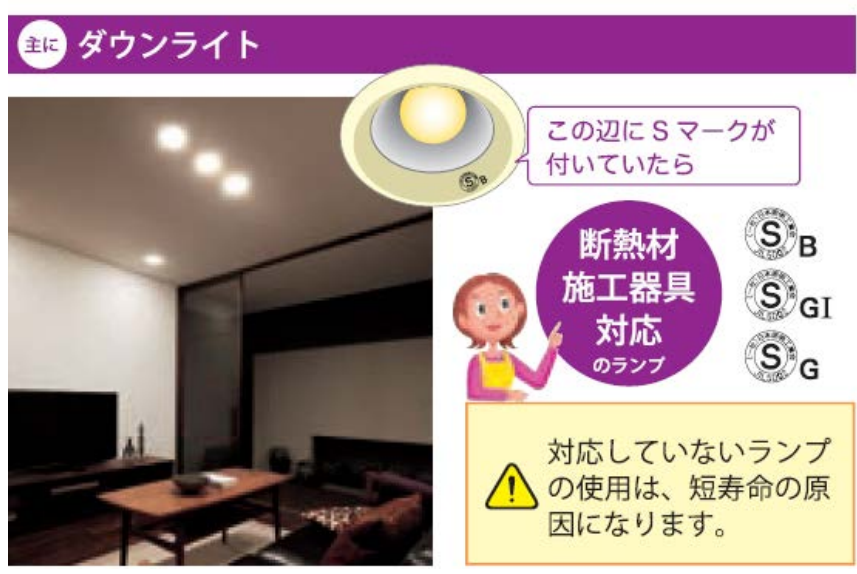
図 7. 断熱材施工器具対応のタイプの例 11

天井に埋め込まれたダウンライトの枠などに下記のSマークがついていたら、断熱材施工器具対応のLED電球を使用しましょう。非対応のLED電球を使用するとLED電球の寿命が短くなるなど不具合の原因になります（図7）。