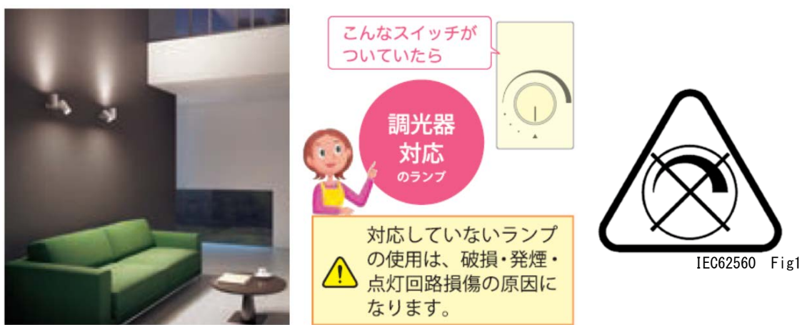
図 6. 調光器タイプの例 9 と注意表示の例 10