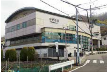
解体予定の 健康福祉センター「オアシス」

問 12月議会で、「サンヒルへ移転すると、妊婦さんや赤ちゃんを乗せた自転車の方等、本当に大変」という市民の声を紹介したが、今回の改修にあたり、市民から意見を聴取したのか問う。 答 市政モニター登録者