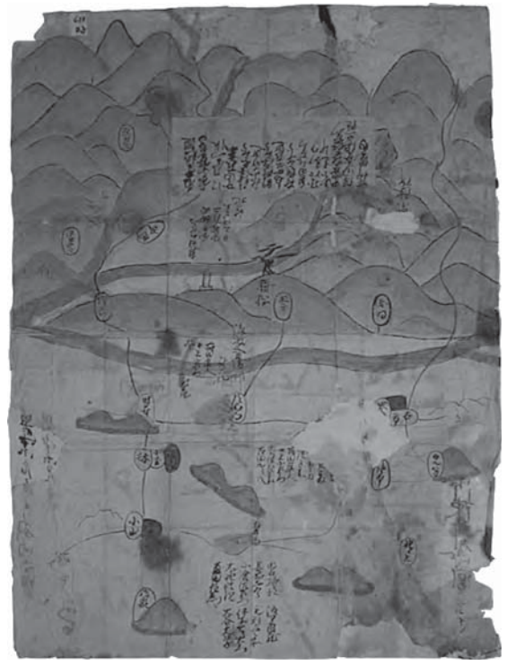
大坂夏の陣 道明寺の戦い 陣地図（個人蔵）