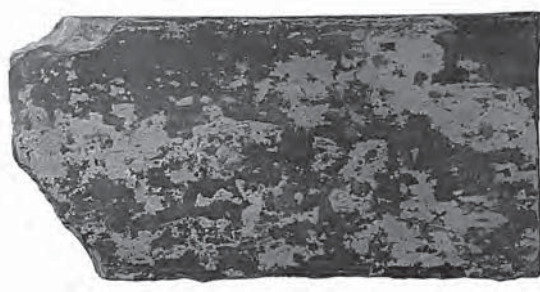
◀ 夾紵棺（安福寺 所蔵，当館 寄託）