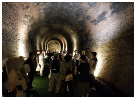
【旧国鉄関西線 亀の瀬トンネル見学の様子】