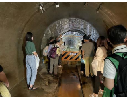
【排水トンネル見学の様子】