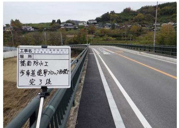
橋面防水(歩道部)施工後