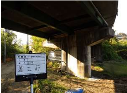
P 5 施工前