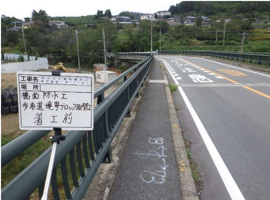
橋面防水(歩道部)施工前