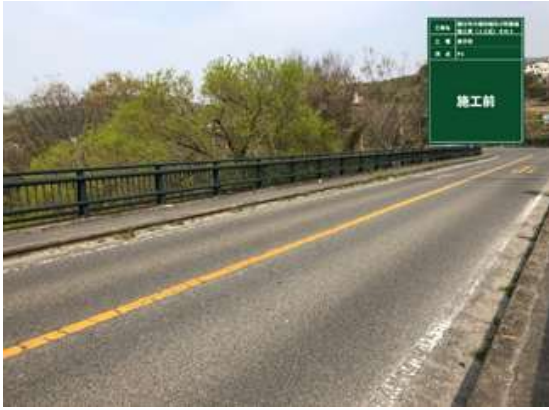
橋面防水(車道部)施工前