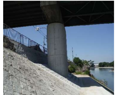
P 1 施工後