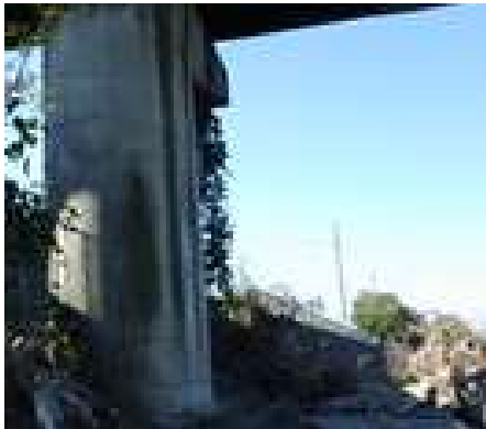
P 1 施工前