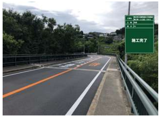
橋面防水(車道部)施工後