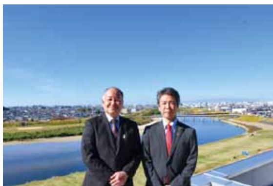
左から、橋本議員・江村議員