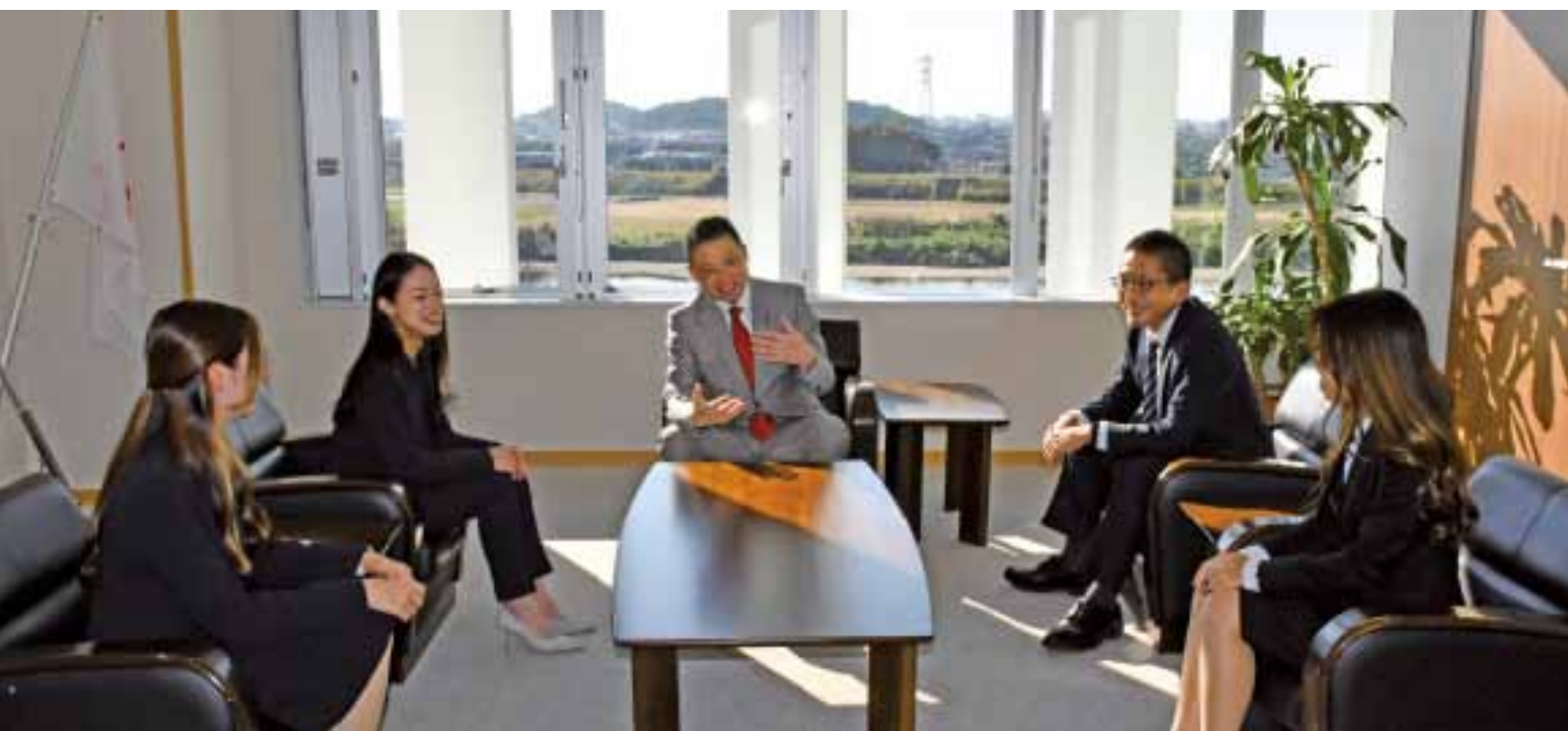
※写真撮影時のみマスクを外しています。座談会はマスクを着用して行いました。