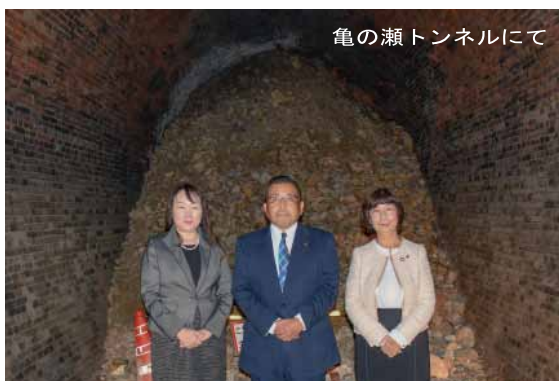
左から、大木議員・中村議員・新屋議員