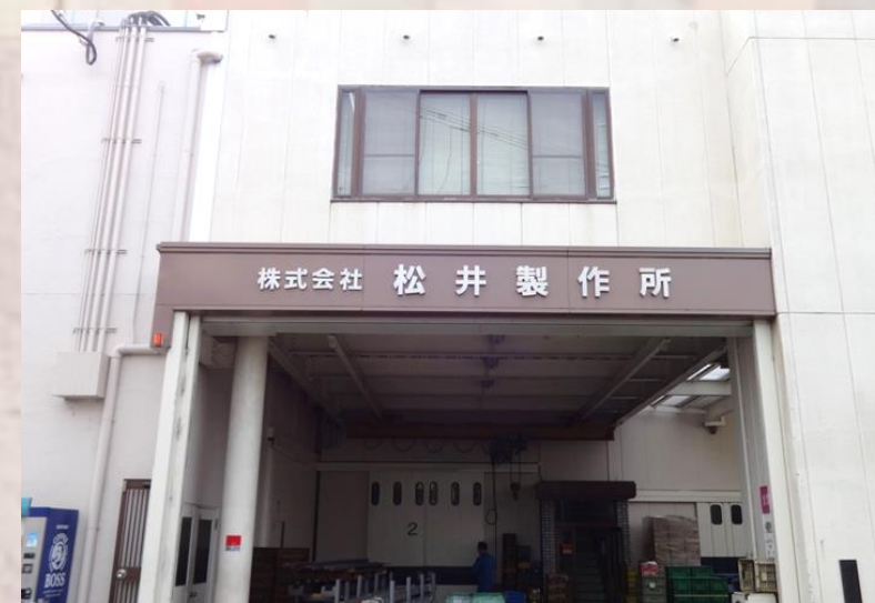
松井製作所の製品の一部