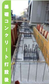
基礎コンクリート打設後