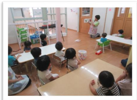
絵本の読み聞かせ