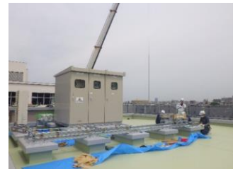
機械設備搬入 (6/27) (キュービクル、室外機等)