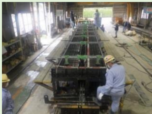
■プレキャスト床版の配筋と型枠の検査

プレキャスト(Pca)床版とは工場で作成される二次製品のコンクリート床版のことです。工場でももって制作しておけるので工期の短縮が見込めます。 工場での制作になるのでこの日は滋賀の工場で製品の配筋や形状の検査を行いました。このような検査が工場内で一つ一つに行われているため品質が均一で精度の高い部材として供給が可能となっています。 また工場制作のもう一つのメリットとして、工場で作成するため規模の大きなコンクリート床版の制作が可能となり柱の無い広い空間が施工できます！