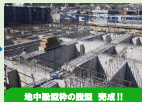
地中梁型枠の脱型 完成!!