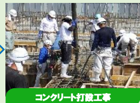
コンクリート打設工事