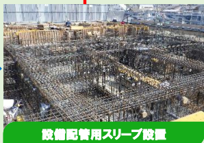
設備配管用スリーブ設置