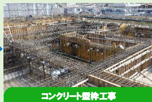
コンクリート型枠工事