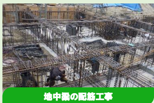
地中梁の配筋工事

配筋の後は設備配管を通すためのスリーブ(穴)を鉄筋の隙間に設置し、型枠で鉄筋の周りを囲みます。そこへコンクリートを流し込み固まったのちに、型枠を外すと新庁舎を支える逞しい地中梁の完成となります！