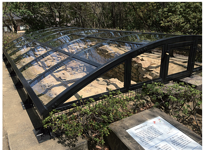
「軍君（昆支王）」に関係する高井田山古墳

漢文で書かれているため、難解な部分もある『日本書紀』ですが、当時の社会情勢を知った上で読むと、より一層興味深い内容になります。今年は『日本書紀』にどっぷりつかってみてはいかがでしょうか。