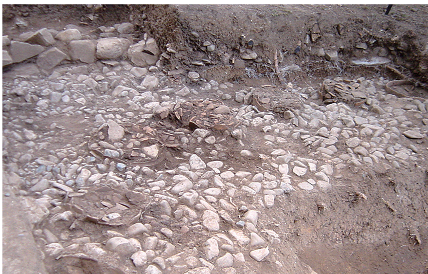
玉手山1号墳のくびれ部（2004年の発掘調査時に撮影）

かつては破壊の危機にあった玉手山1号墳ですが、今回の指定を契機に保存、管理、活用について充実させていきたいと考えています。