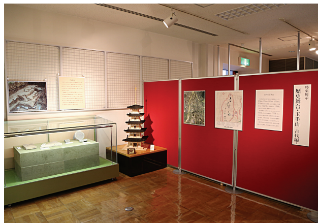
特集展示「歴史舞台・玉手山－古代編－」

特集展示は、各期間を見てわかるように展示替えの時間が 1 日しかなく、準備が大変です。ただ展示期間やテーマは比較的自由度が高く、企画展とは違った切り口の展示が可能です。今後の展示を充実させるために、たくさんのご意見をお聞かせください。なお令和 2 年 2 月 4 日～4 月 26 日には「大阪万博から 50 年－田中友幸が描いた未来－」を開催します。どうぞお楽しみに！