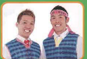
ゲストランナー ランナーズ

お問い合わせ 参加申込に関する問い合わせ・・・ 柏原シティキャンパスマラソンエントリー事務局 ☎0794-70-8200 大会に関する問合せ先・・・ 柏原市教育委員会スポーツ推進課 ☎072-972-1689