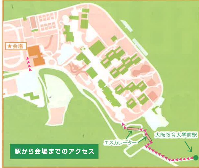
駅から会場までのアクセス