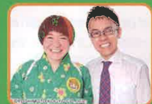
応援ゲスト女と男