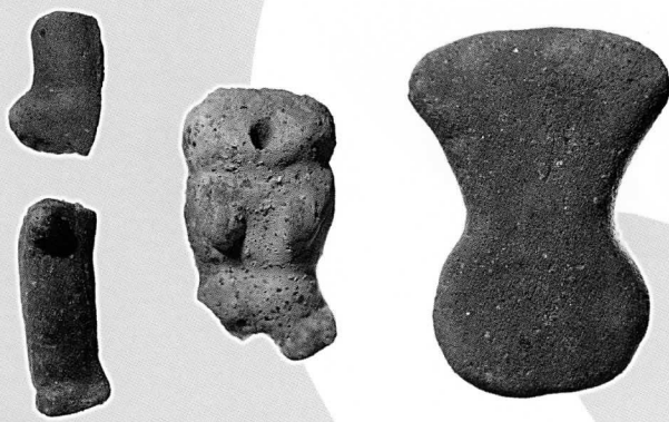
土偶—船橋遺跡 (大阪府立弥生文化博物館所蔵)