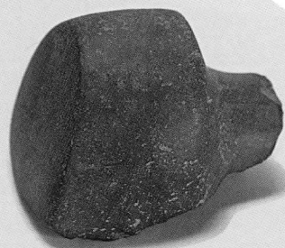
ぎよぶつせっき 御物石器—船橋遺跡 (大阪府立弥生文化博物館所蔵)