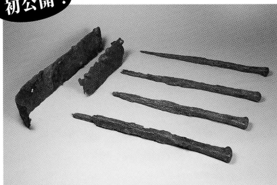
講堂跡出土 扉金具