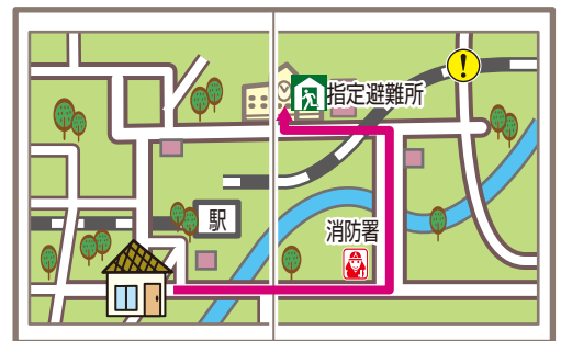
オリジナルマップイメージ