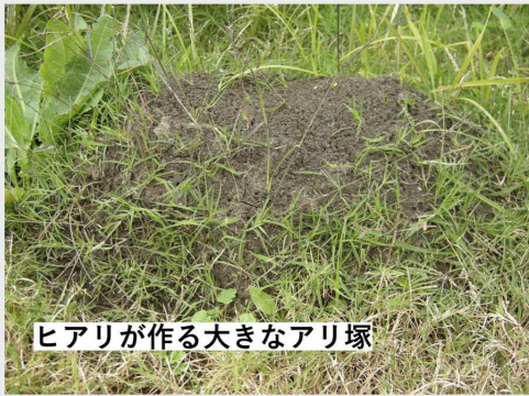
ヒアリが作る大きなアリ塚