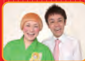
応援ゲスト 女と男