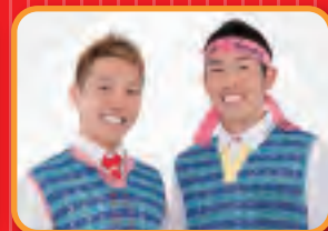
ゲストランナー ランナース