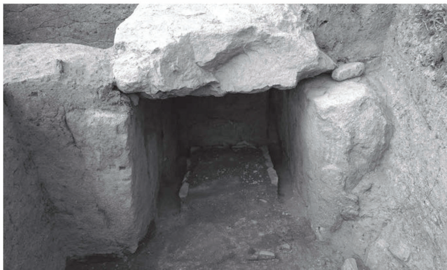
平尾山古墳群 平野・大県第 13 支群 15 号墳