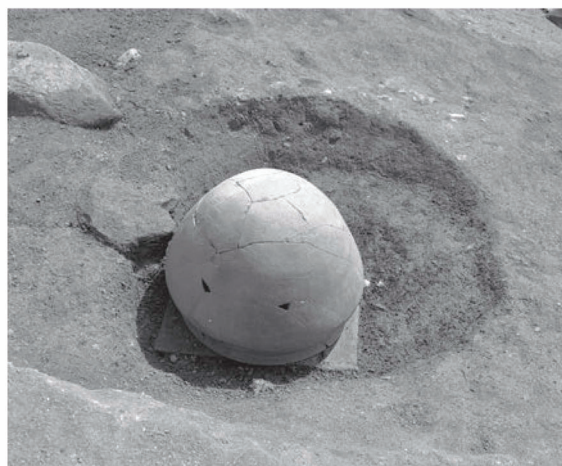
田辺墳墓群 8 号墓